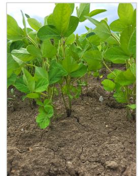
Dravsko polje 2024