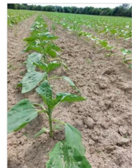
Vzhodna Slovenija 2024